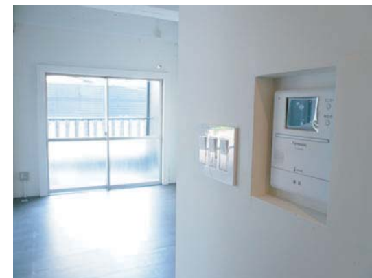
すっきりと収納されたカメラ付インターホン