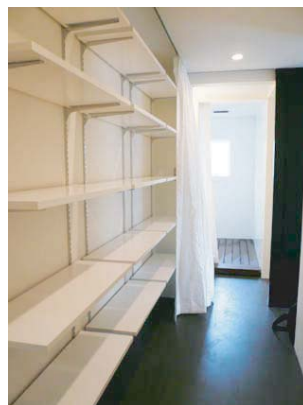
モノトーン系の室内を 白熱灯が明るく照らす