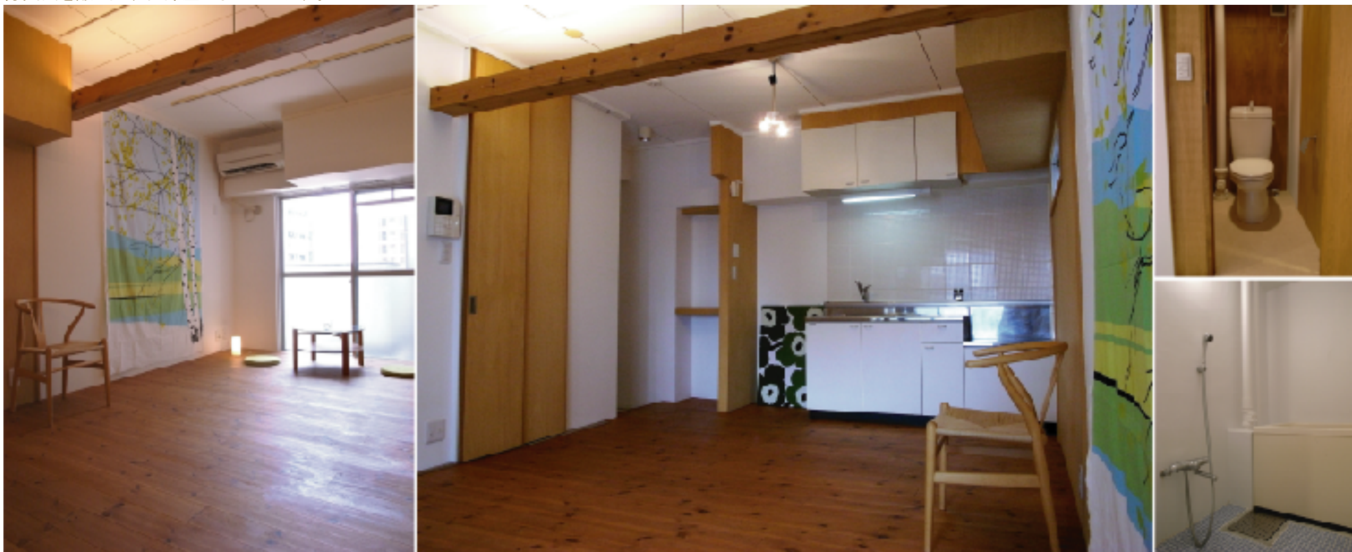
※写真と現況に誤差がある場合は、現況優先となります。

リノベーションという言葉がまだまだ浸透していない2005年に完成した当社の初期リノベーションルーム。無垢フローリングの室内には同じ素材の梁が一本スツと走り、そのラインと共に天井には間接光が浮かび上がります。間接照明に、無垢フローリング、壁に多用されたシナ合板の色合い、浴室・キッチン表情豊かなタイル。どれをとっても今も色褪せることなく、それ以上に深みを増したこの部屋の引き立て役たちのおかげで、サスティナブルなアイデアを大切に作る北欧の住まいに似たゆるやかな雰囲気醸し出すお部屋となっています。