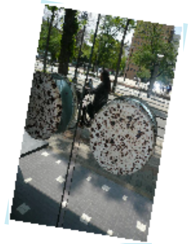
いいビルはいい扉から！