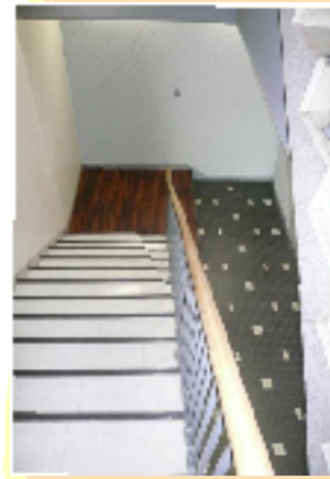
共用部分もこんなにお洒落