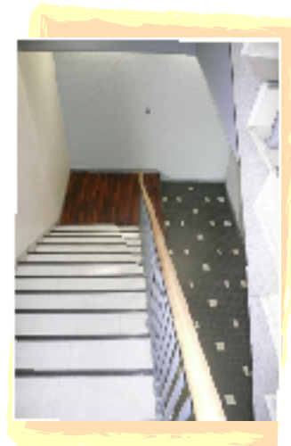
共用部分もこんなにお洒落