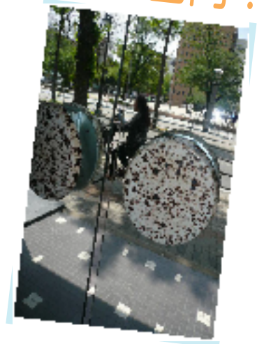
いいビルはいい扉から!