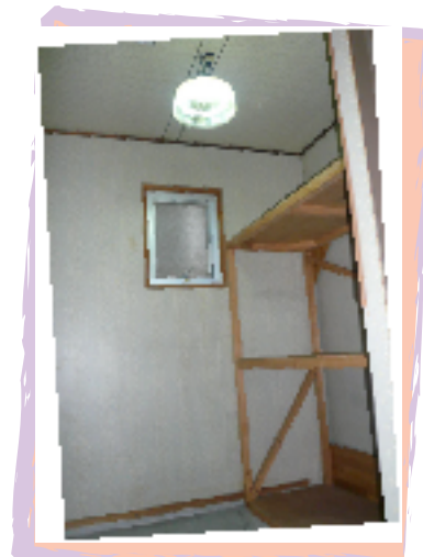
嬉しいおまけ。立派な物置付き