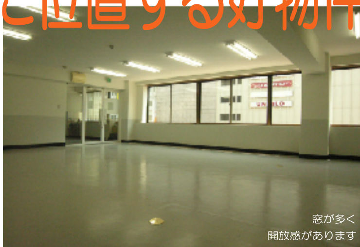
窓が多く 開放感があります

賃料 189,000円 (税込) 共益費 42,000円 (税込) 敷金 6ヶ月