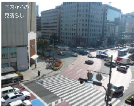
室内からの 見晴らし