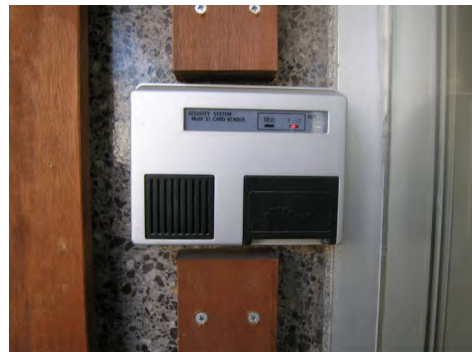
安心のセキュリティー