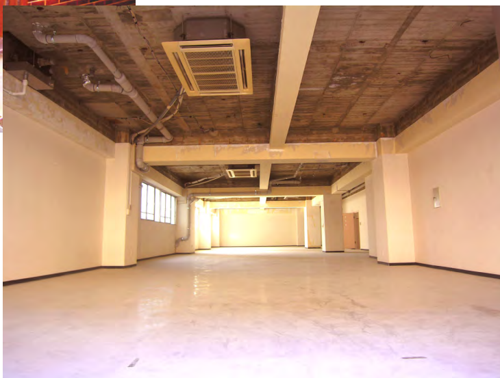
大容量の倉庫として