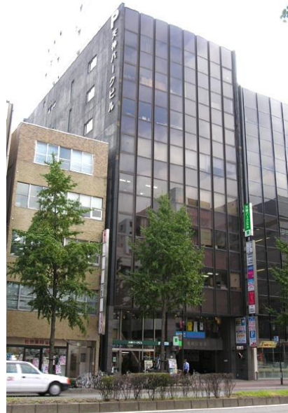
昭和通り沿いに立地