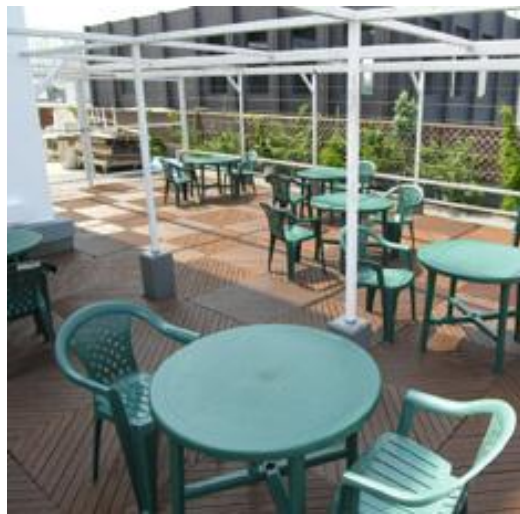
屋上オープンテラスが気持ちいい