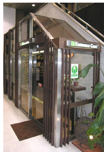
1F「エントランスカフェ」