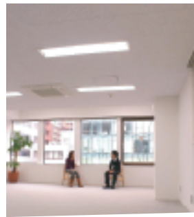
白が基調のナチュラル空間