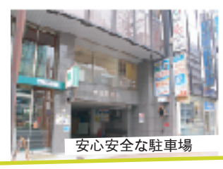
安心安全な駐車場