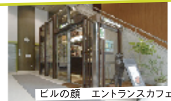
ビルの顔 エントランスカフェ