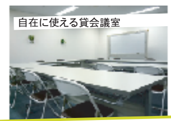
自在に使える貸会議室