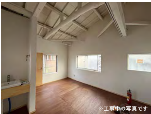
※工事中の写真です