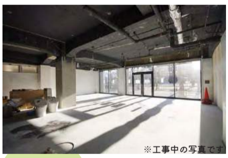
※工事中の写真です

ビルの1階区画の工事や募集が、偶然にも複数の建物で始まっています。建物の1階はビルの顔。まちと建物をつなぐ、大切な存在です。どんなテナントさんが入り、どのような場になっていくのか、とても楽しみです！