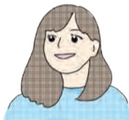
広報チームしんの

六本松一丁目は近年、路地に建つ古い建物を改修した店舗が増加しているエリア。店主の独自性やこだわりが表現された、わざわざ訪れたいくなるお店が点在しています。また、地下鉄七隈線「六本松駅」からもほど近く、大通り沿いには複合商業施設や金融機関などが建ち並び、利便性も兼ねそなえたまちです。