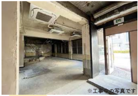
※工事中の写真です

蝶和ビル/博多区店屋町 1階 A区画 112㎡ (33.8坪) / B区画 111㎡ (33.5坪) 用途：店舗・オフィス・ギャラリー・軽飲食店 (A区画のみ) など 冷泉公園を目の前に望む開放的なA区画と、その裏面のおもしろいアプローチのB区画。