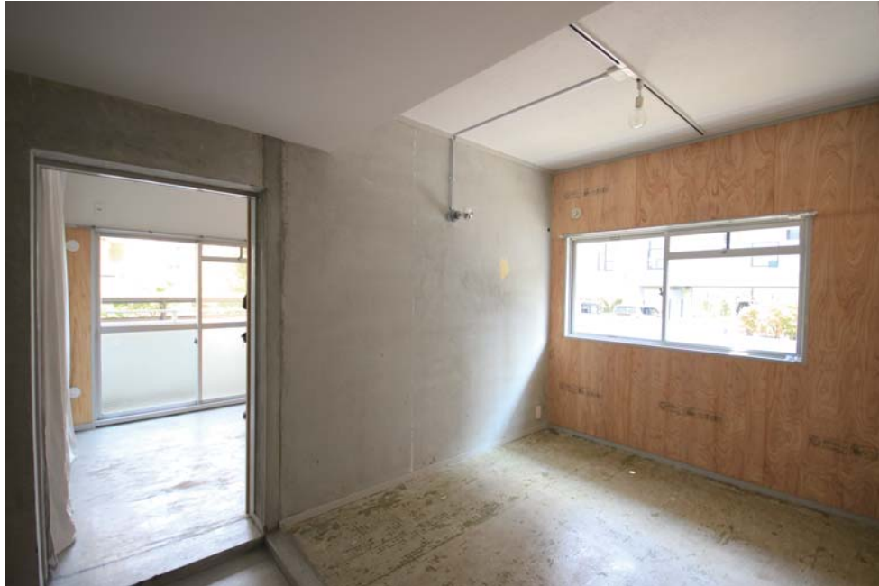
◇太陽光の入る1階角部屋。玄関から続く広々とした土間空間は、アトリエやギャラリー等シゴトバにも◎