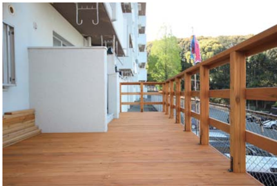
◇バルコニーの先には小箱の自然を望む開放的なウッドデッキ