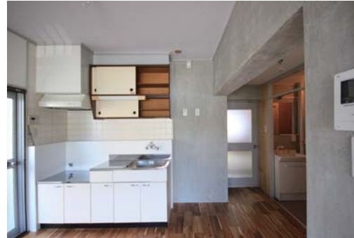
◇バルコニーに隣接した明るいキッチン