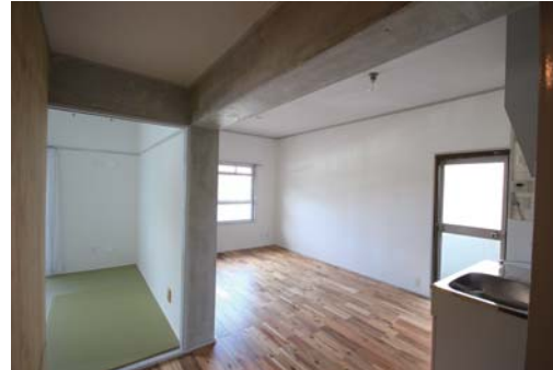
◇アカシアの無垢フローリング仕様のLDK