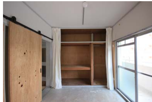
◇2面採光で明るい収納付きの土間スペース