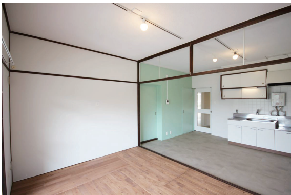
◇欄間のレトロさとミント色がユニークなLDK