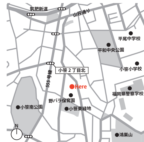
■MAP(福岡市中央区小笹1-15-10) 西鉄バス「小笹」停より徒歩4分