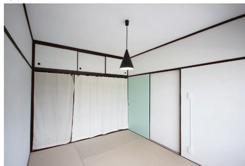
◇和室としても洋室としても利用できる麻畳スペース