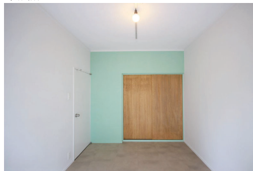
◇朝日の差し込む明るい洋室