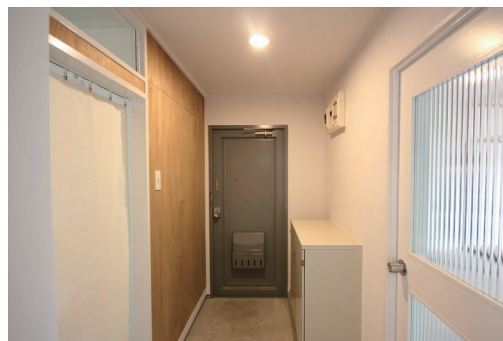
◇靴箱付きのシンプルな玄関スペース