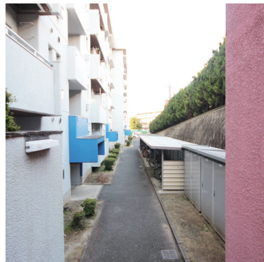
◇管理の行き届いた綺麗な共用部