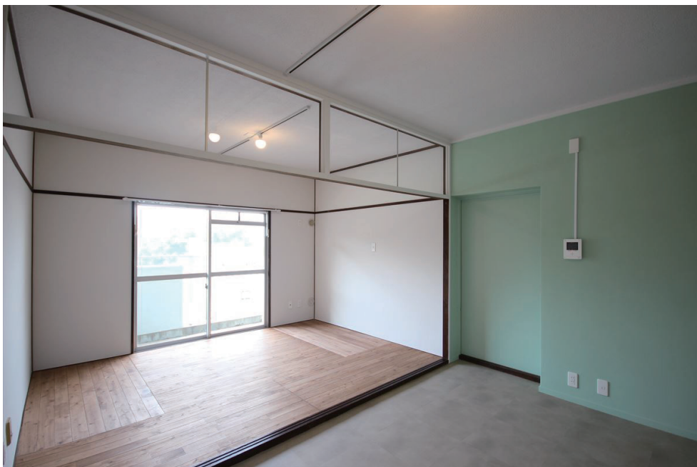
◇畳のように貼られた桜の無垢フローリングでごろんと寝ころびたいLDKスペース