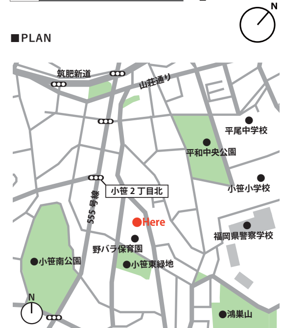
■MAP (福岡市中央区小笹 1-15-10) 西鉄バス「小笹」停より徒歩4分