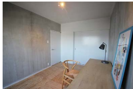
◇クローゼット付き洋室