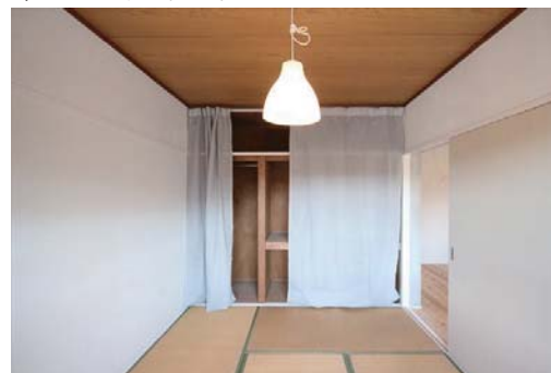
◇光の差し込む明るい和室 ※写真は畳の表替え前