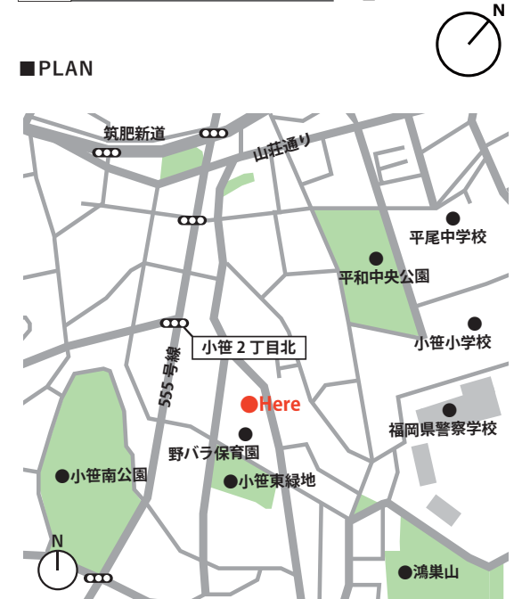
■MAP (福岡市中央区小笹 1-15-10) 西鉄バス「小笹」停より徒歩4分