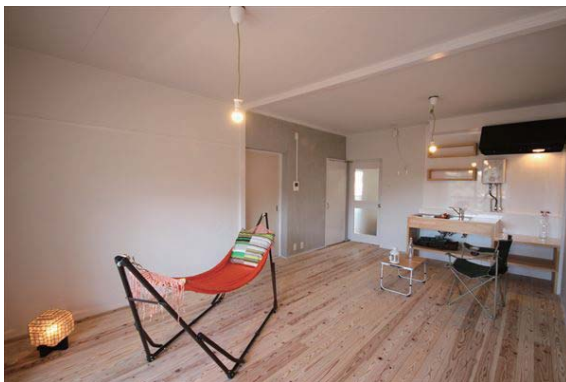
◇タイル貼りの特注キッチンを備えています