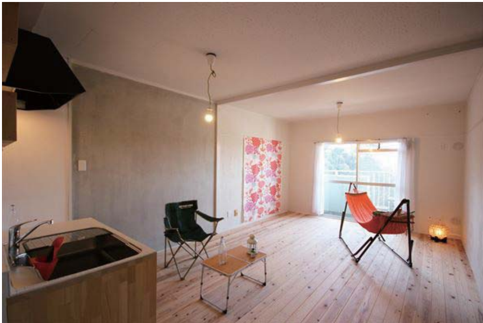
◇コンクリート現しと無垢床が魅力的な白を基調としたLDK