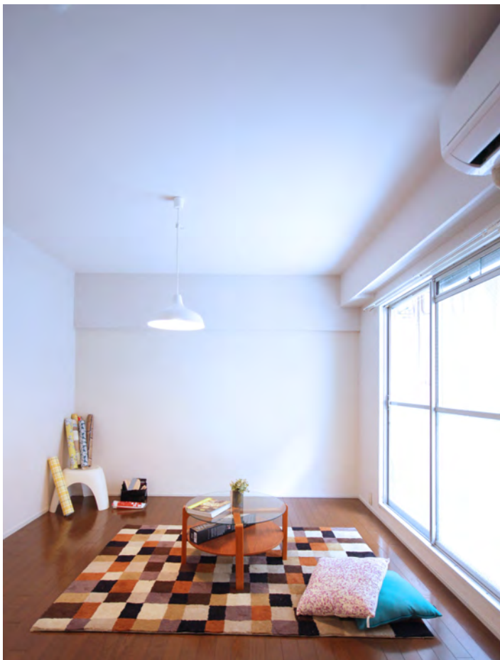
真っ白の壁紙から始める、輸入壁紙ショップ「WALPA」の壁紙で クリエイティビティが刺激される、壁紙を楽しむ。