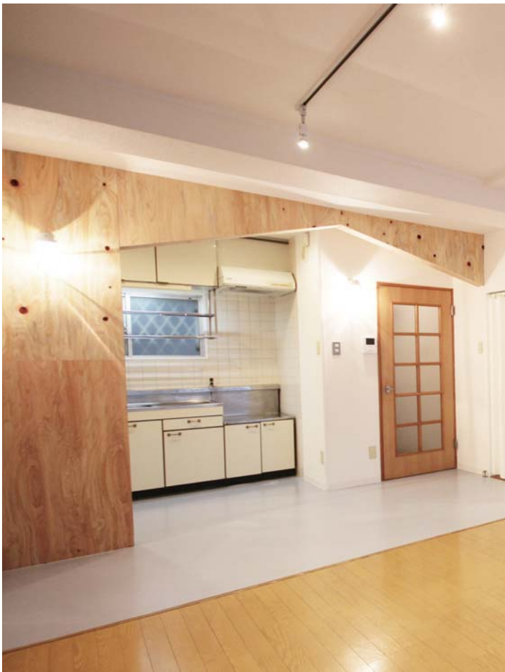
山小屋をイメージさせるアーチ型の間仕切り