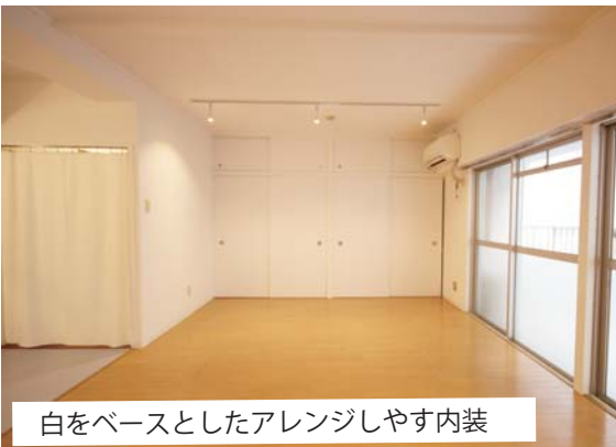
白をベースとしたアレンジしやすい内装