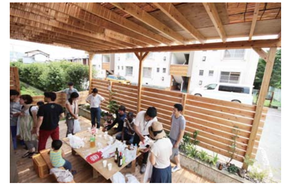
住人さんやご近所さん参加型のイベントを定期的開催!