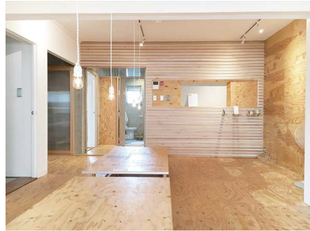
◆リノベーション事例