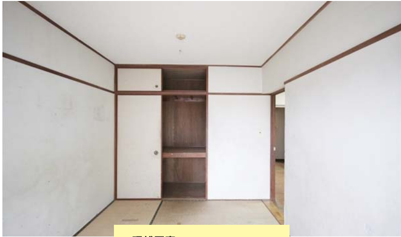
現状写真※部屋によって異なります

■店舗・事務所・ギャラリー・アトリエ等相談可 ■現状渡し/原状回復不要 (要事前申請)