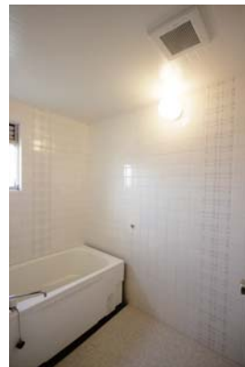
◆浴室・洗面・トイレ(ウォシュレット付)