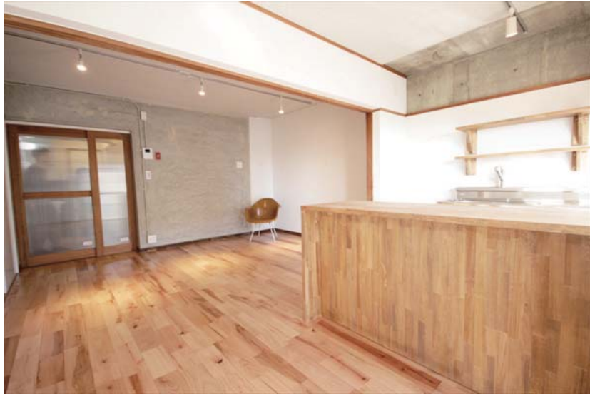
◆キッチンカウンター付きのLDK