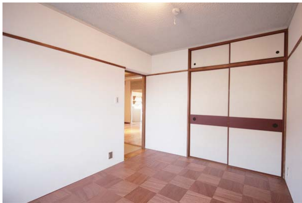
◆市松貼りの木床が魅力的な洋室