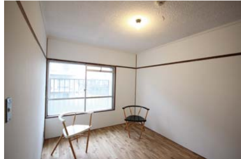
北側の洋室にも無垢材を使用