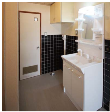
洗面所 ※洗面台新設