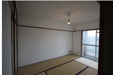
南側で光の入る明るい和室