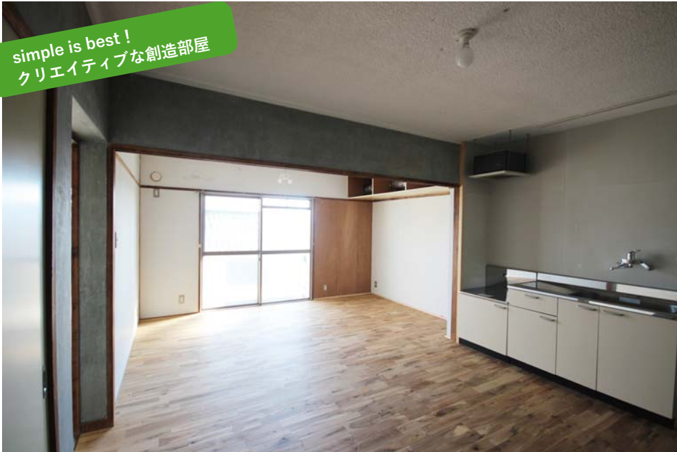
可変性ある余白を残すシンプルなテイスト