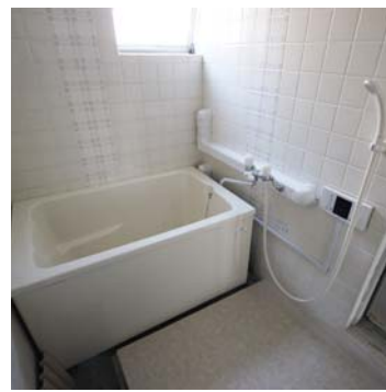
浴室 (追焚き機能付)