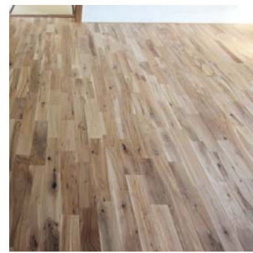
ナラ (オーク) の無垢材が気持ちいい