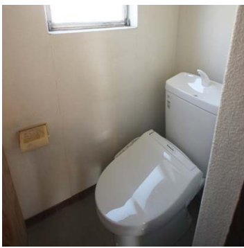
ウォシュレット付トイレ