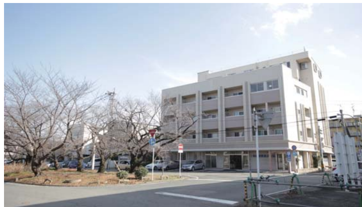
□建物外観。春には前面道路が桜色に染まります