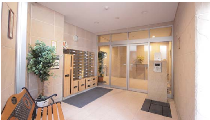
□オートロック、宅配ボックスを備えたエントランス