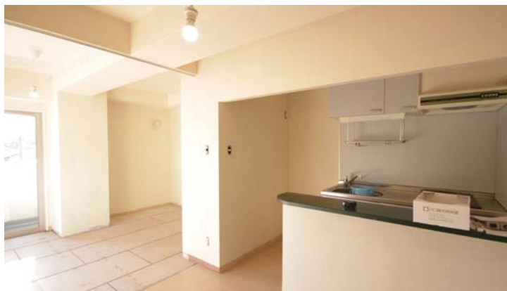
□リビングとダイニングは既存の建具で仕切って使うこともできます