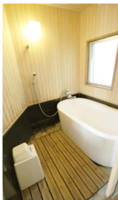
▲浴室はヒノキの壁