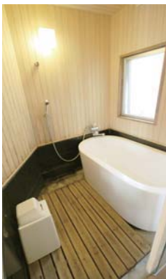
▲浴室はヒノキの壁