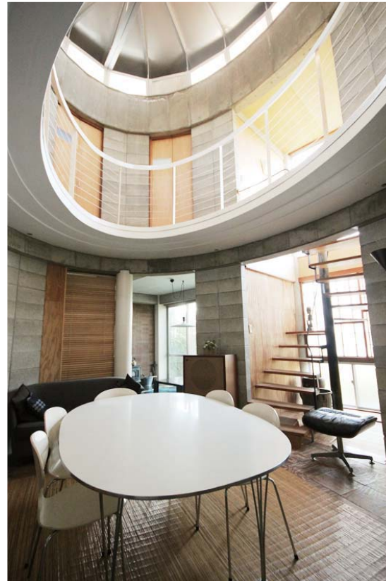
▲吹き抜けになっている共用のリビングとダイニング