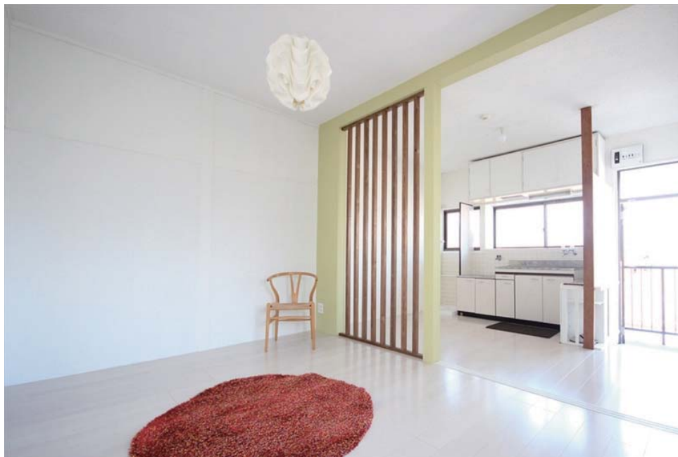
窓から差し込む光が壁に反射し、柔らかな雰囲気。天井が高く開放感のある室内。