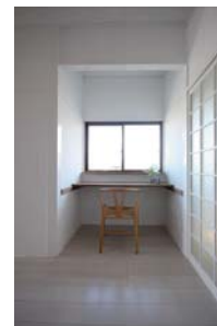
出窓にはカウンター