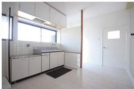
キッチンは大きな窓からの光でいつも明るい