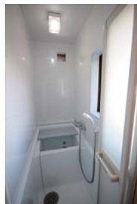
コンパクトな浴室