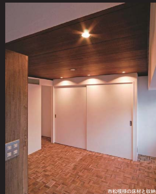
市松模様の床材と収納