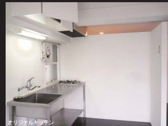
オリジナルキッチン