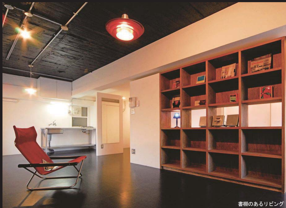
書棚のあるリビング