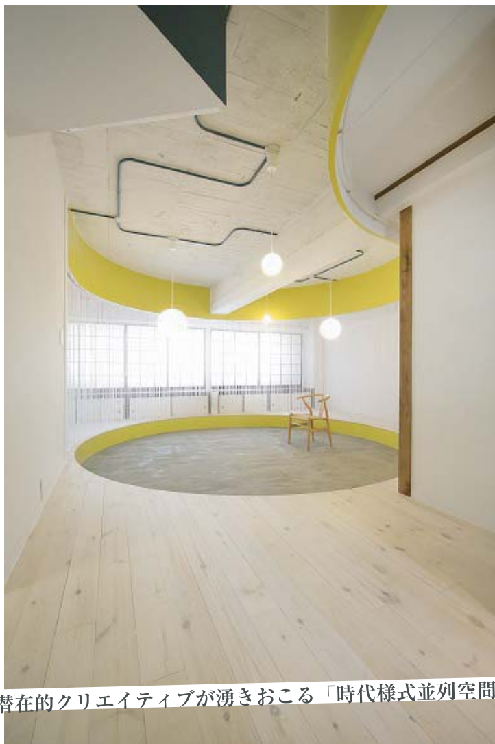
潜在的クリエイティブが湧きおこる「時代様式並列空間」

retro 30% Renovation 30% avant-garde 40%