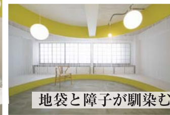
地袋と障子が馴染む

あなたならどうつかう？住む？働く？集まる？ 新と古がリミックスする空間をクリエイティブに楽しむ