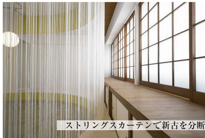
ストリングスカーテンで新古を分断