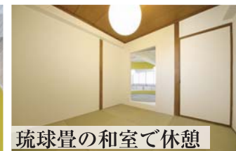
琉球畳の和室で休憩