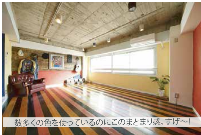
数多くの色を使っているのにこのまとまり感。すげ〜!