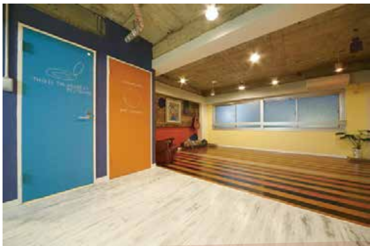
洋服をリメイクするように空間をリメイクしたアート空間!