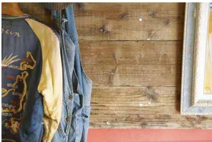
使い込まれた足場板を壁面に。そこは自由に手を入れることができる