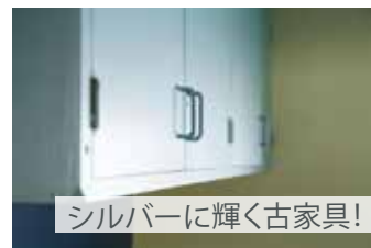
シルバーに輝く古家具!