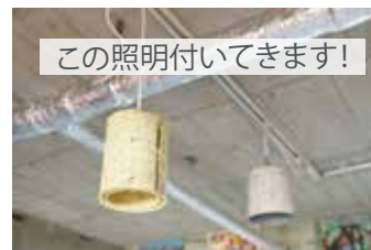
この照明付いてきます!