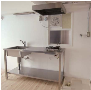
シンプルなキッチンの横に洗濯機置き場があります