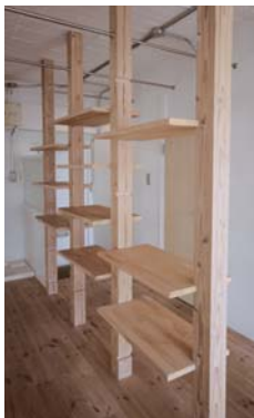
大胆でオープンな可動式の飾り棚