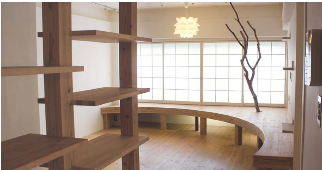
昔の部屋の名残を随所に留めながら、自然素材をふんだんに使用した心地よい空間