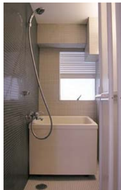
白と黒のモザイクタイル仕上げの浴室