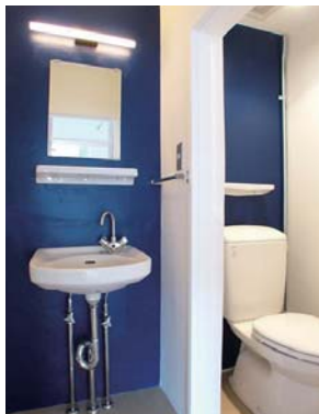
レトロでかわいい洗面台とトイレ