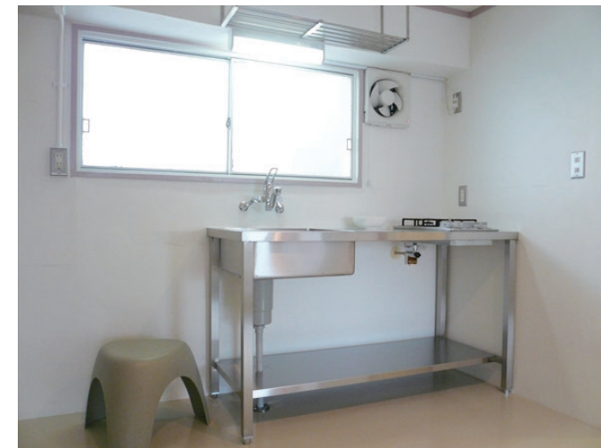
2口コンロ付きのオリジナルキッチン