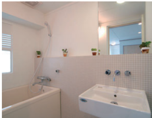
モザイクタイル貼の浴室・洗面スペース