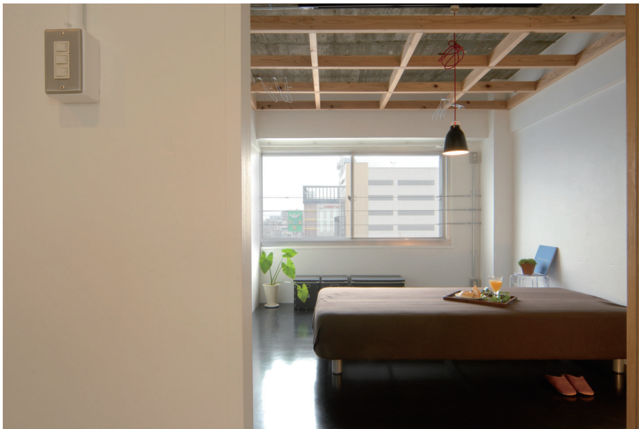
ランドリースペースを兼ねたベッドルーム