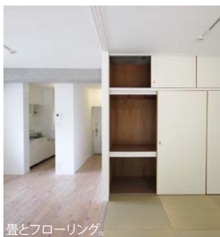
畳とフローリング。

室内とほぼ同規模のバルコニー。 壁面には個性的な壁紙と腰高の窓があり、床は畳と無垢フローリング。 様々な要素があることで、働く場としての使い方が広がります。