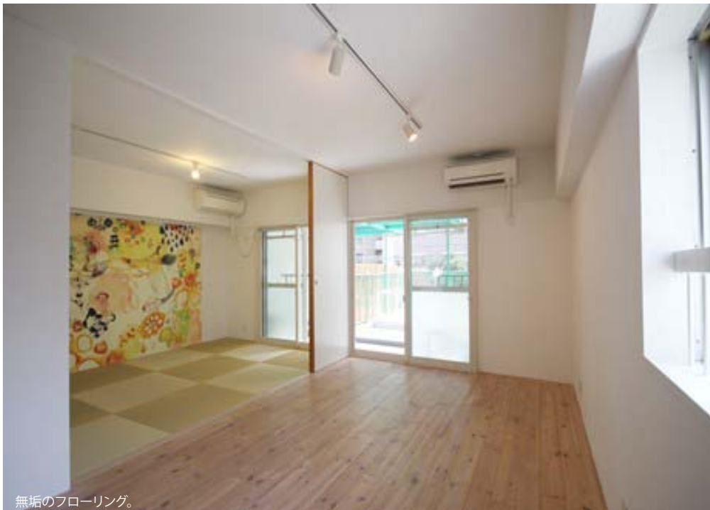
無垢のフローリング。

■住所 福岡市中央区清川12-4-29 ■アクセス (バス) 高砂2丁目 徒歩2分 柳橋バス停 徒歩5分 (地下鉄) 渡辺通駅 徒歩5分