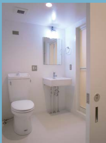
□洗面所・トイレ(※ウォシュレット付)