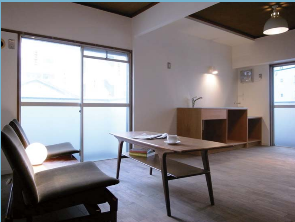
□リビング・ダイニング