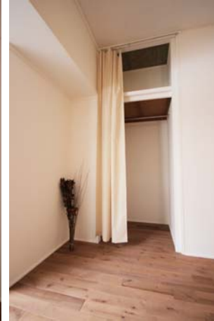
□カーテン付き収納