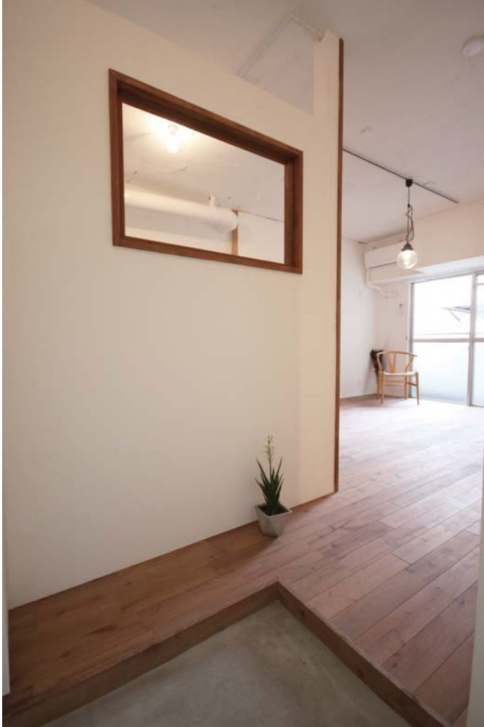
□元々部屋にあった木建具をはめ込んだ間仕切り