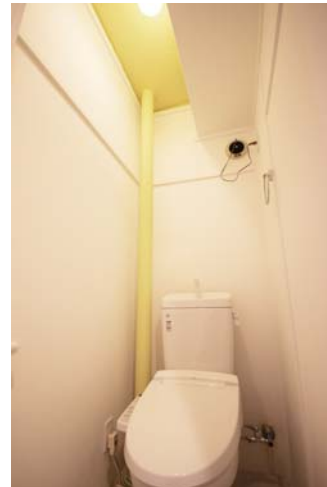
□トイレ(ウォシュレット付)