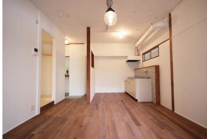
□小窓のある間仕切りで空間分けされた玄関とキッチン