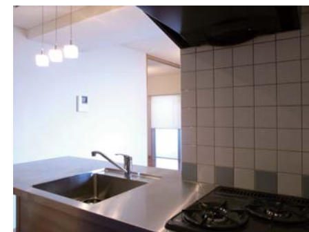
カスタムオーダーのキッチン