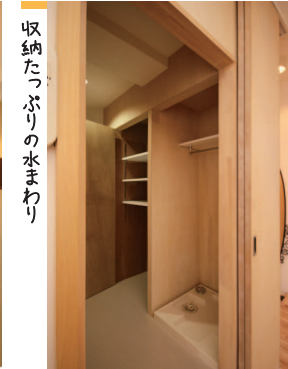
収納たっぷりの水まわり