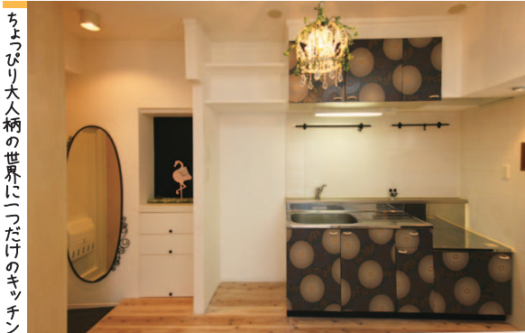
ちよびり大人柄の世界に一つだけのキッチン

メリハリのある白と紺の壁。床の無垢材と梁のように渡る一本の木材が木の温かさを与えてくれるお部屋です