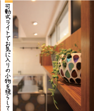
可動式ライトでお気に入りの小物を照らして