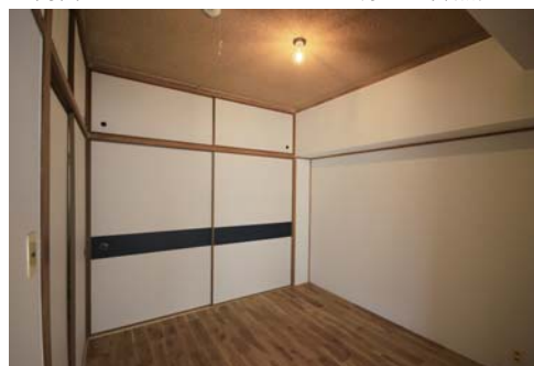
□襖のデザインが特徴的な洋室