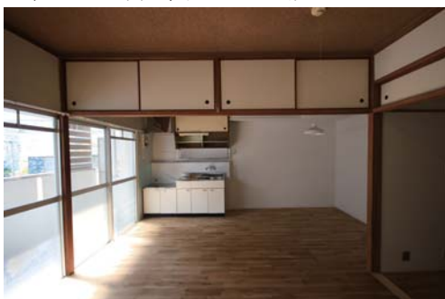
□既存デザインの趣を残す鴨居と襖