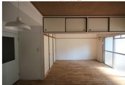
□南西向きバルコニーからは明るい自然光