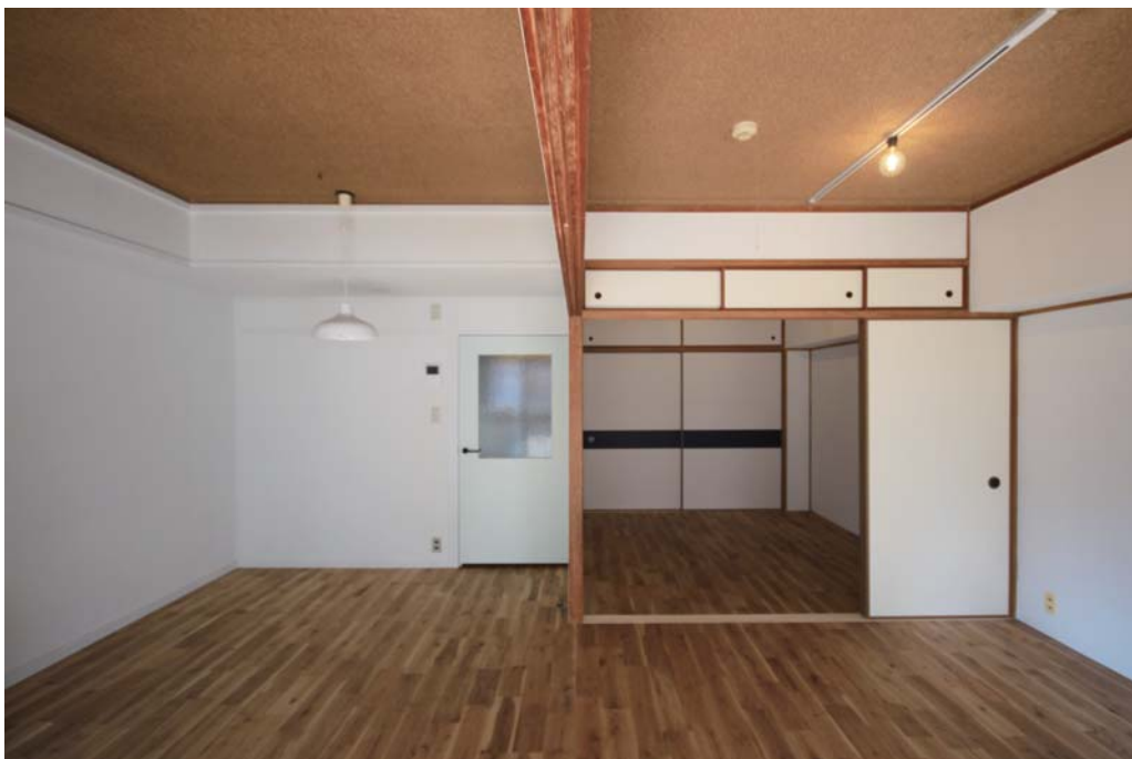
□床のほぼ全面は、足ざわりの滑らかなナラの無垢フローリング仕上げ