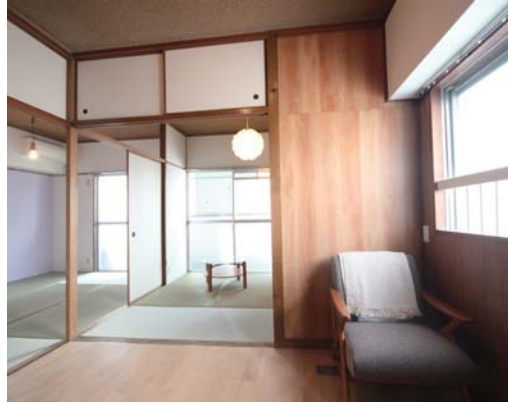
▲二面採光の明るい室内