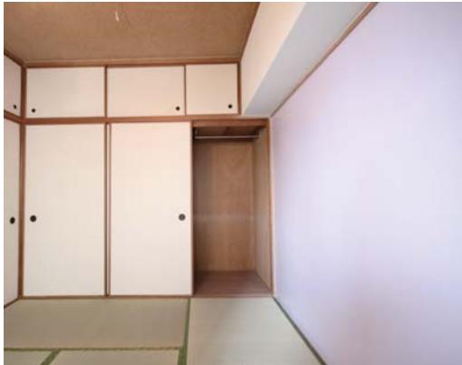
▲押入れを活用したクローゼット