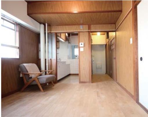
▲既存レトロ+無垢フローリング