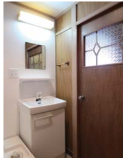
▲ガラスが可愛いレトロ建具