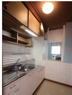
▲独立型のキッチン