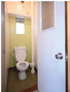
▲黄緑色のアクセントカラー