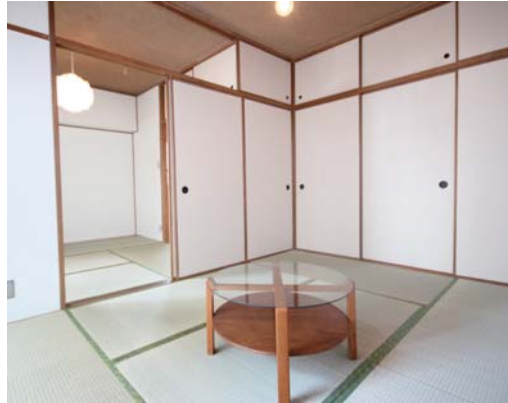
▲奥の和室は襖で仕切ると個室に