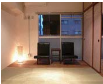
畳とバルコニーの縁を区切る板の間