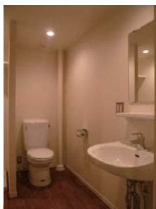
お手洗い・洗面もフローリング