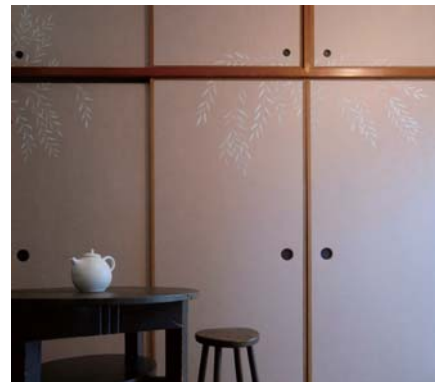
ふすまに描かれた日本画はこの部屋だけのもの