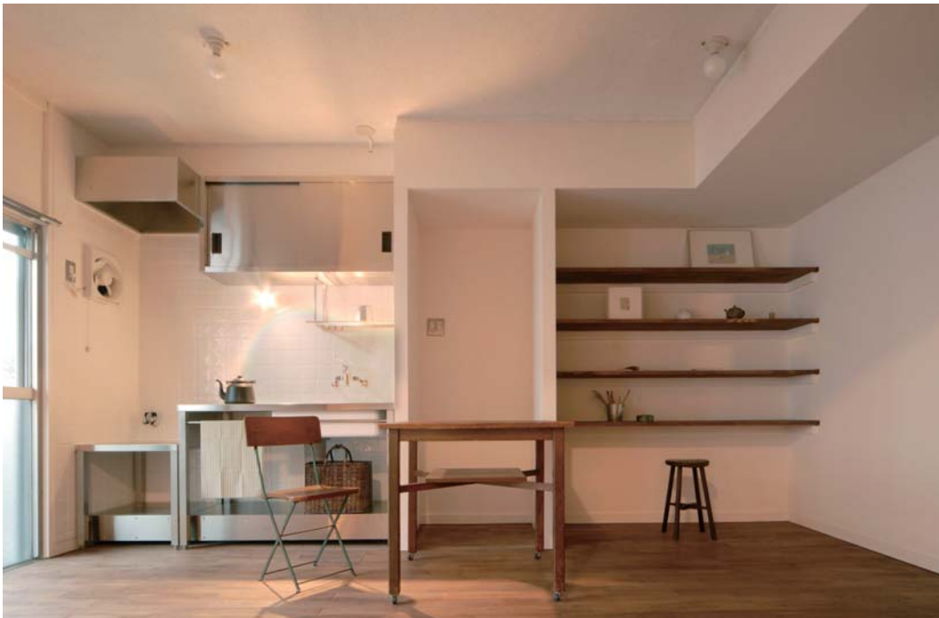
ダイニングキッチンがウォールナット塗装仕上げのフローリング