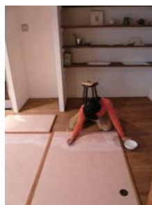
日本画家 アトリ工 穂音さんの作