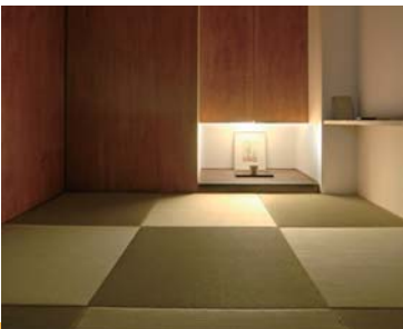
畳は温かみだけでなく、寝転がれる自由を与えてくれる