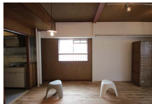
□朝陽の入る既存デザインの小さな窓