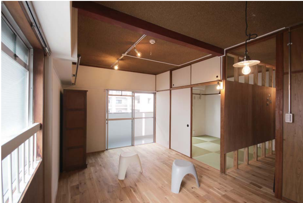
□42年間の痕跡を残し、新たなデザインを層に重ねる