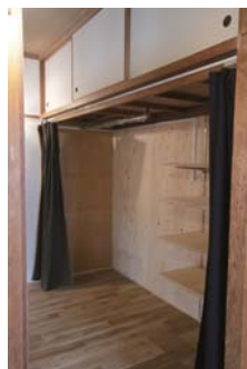
□カーテン付き収納