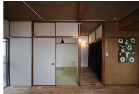
□レトロな雰囲気に合う電球照明