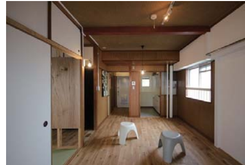
□2DKを1LDKへとリノベート