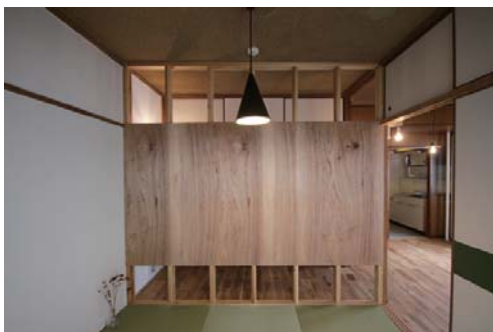
□和室の間仕切り ★合板部分はDIY可