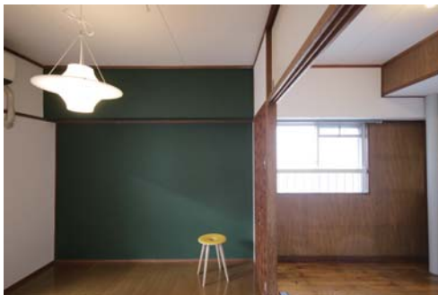
□教室のような、どこか懐かしい雰囲気