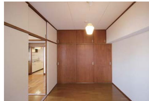
□十分な広さのある収納&クローゼット