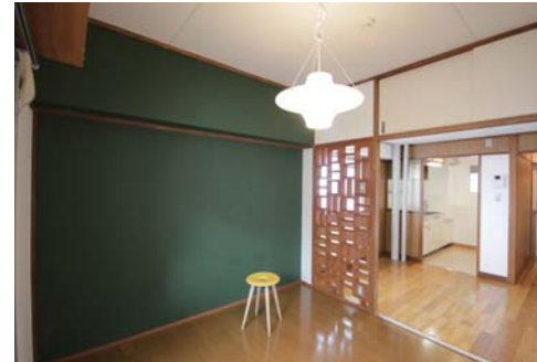
□深緑色の壁がアクセント