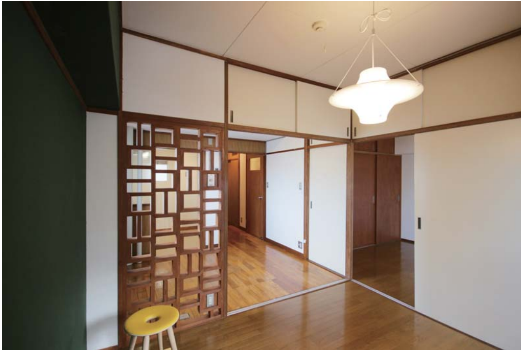
□昼と夜の雰囲気ガラリと一変、光と風を通すパーテーション