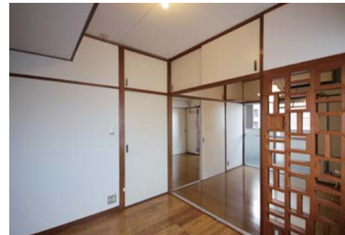
□引き戸を外し部屋をつなげてOK