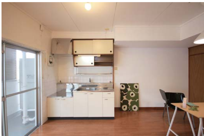
□広々としたキッチンスペース