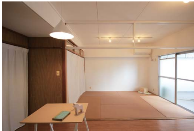
□シンプルでやさしいデザイン