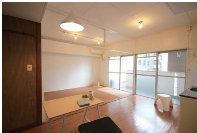
□大きな窓に面する異素材で構成されたLDK