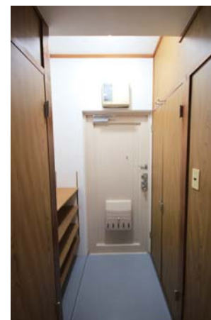
□大きな収納付きの玄関