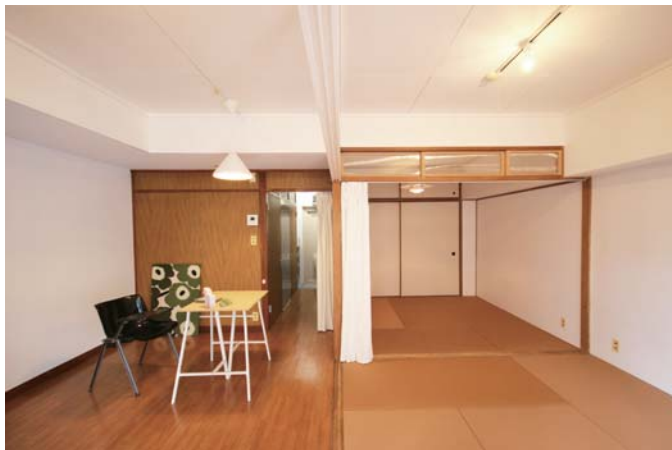
□垂麻色の畳で、全体がまとまりのある空間に