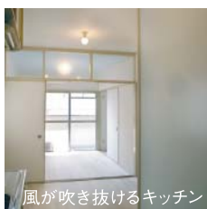
風が吹き抜けるキッチン