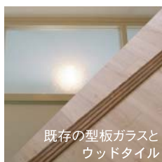
既存の型板ガラスと ウッドタイル