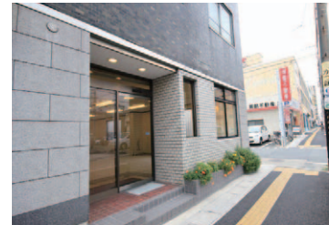
きよみ通りに面した1階