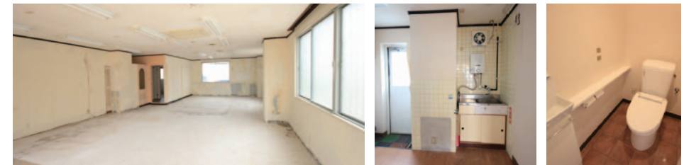
3面採光の明るい区画です