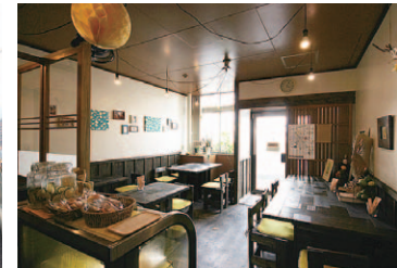
同じフロアには「Cafe檸檬」さんが入居中