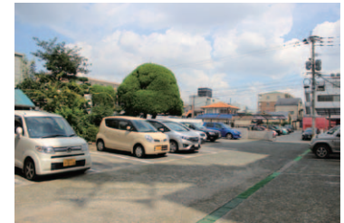
敷地内に駐車場・駐車が出来ます