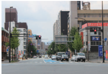
清水四つ角より徒歩1分