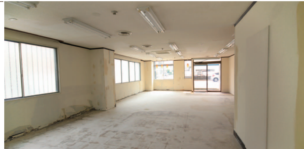
壁面は下地処理をしているので、そのまま好きな壁紙を貼ることができます