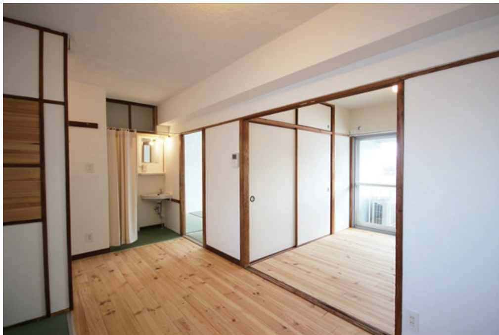
■洋室からダイニングへと無垢フローリングでつながる広々としたスペース