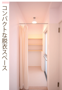
コンパクトな脱衣スペース