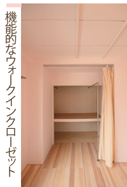
機能的なウォークインクローゼット