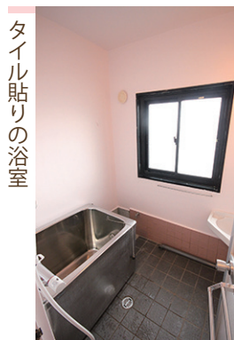
タイル貼りの浴室