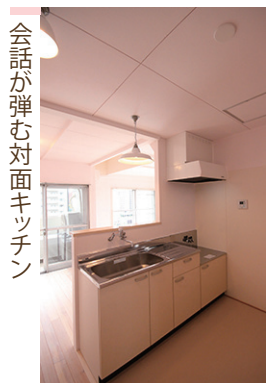
会話が弾む対面キッチン