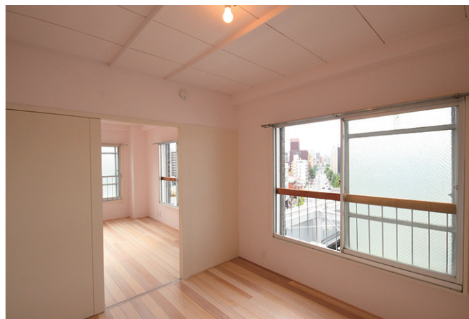
ピンクとベージュの柔らかい雰囲気洋室