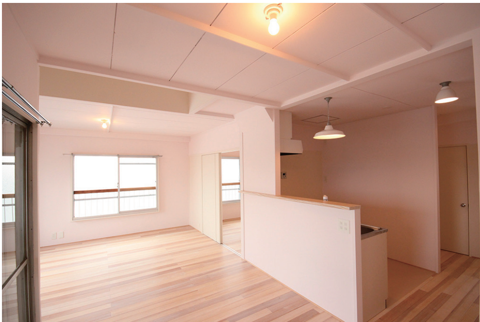
無垢フローリングと3面採光の明るいLDK