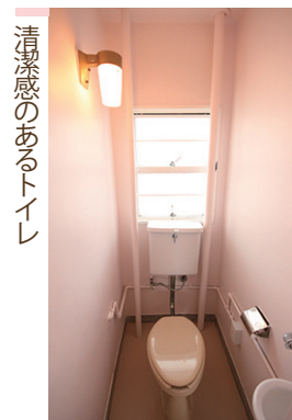
清潔感のあるトイレ