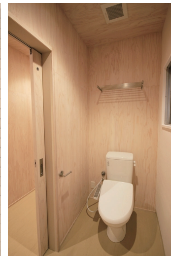
□男女別共用トイレ