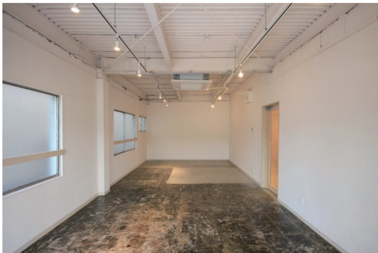
□天井デッキスラブ・床コンクリート現しの空間