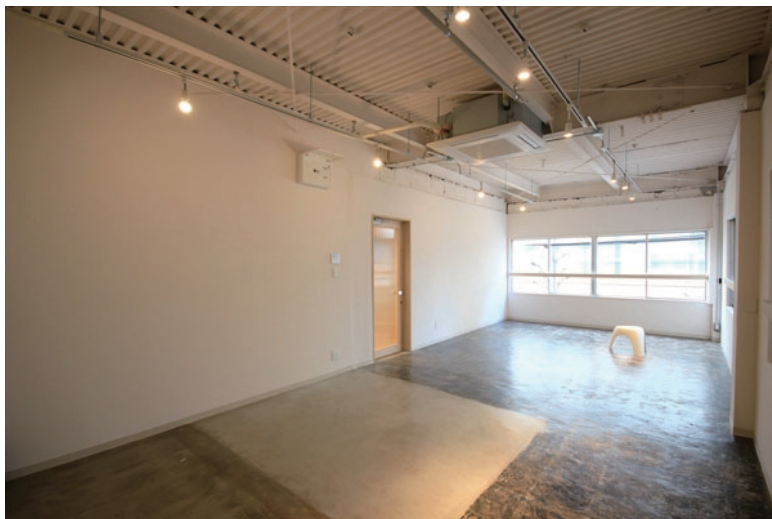
□日差しが入る明るい室内