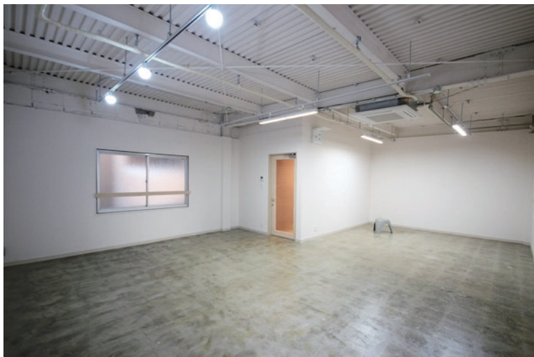
□天井デッキスラブ・床コンクリート現しの空間