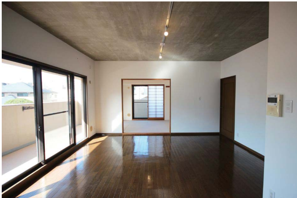
大きな窓。その向こうには川が流れ、水辺の豊かさを感じます