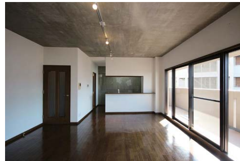
キッチンを含めて16帖のLDK