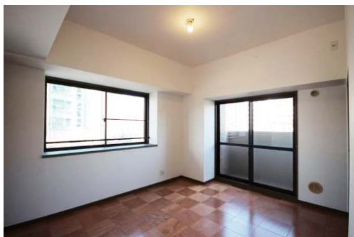
洋室1 床は合板の市松貼り仕上