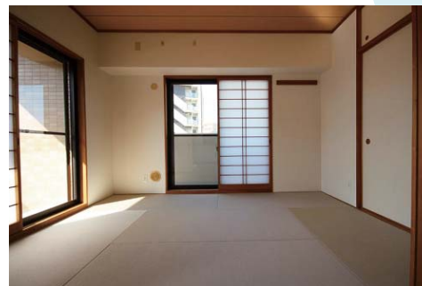
和紙畳を使用した和室