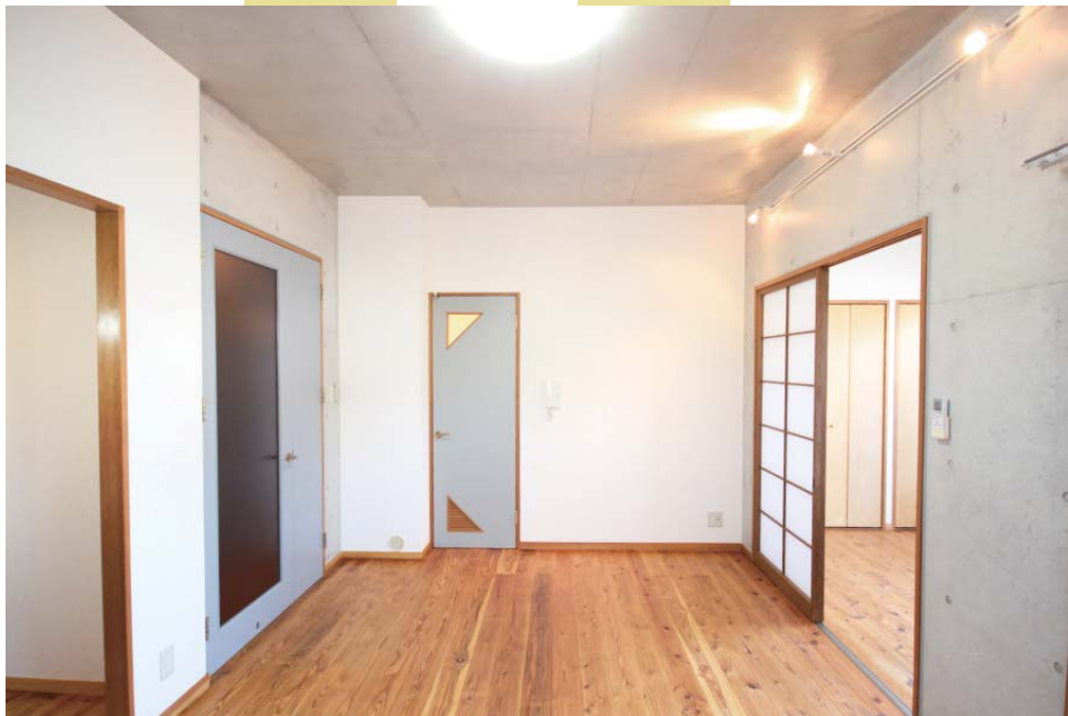
a. コンクリートと木の調和されたさわやかなリビング

福岡市の中心部から少し離れたエリアにある賃貸マンション・ウイングコート次郎丸。平成15年竣工ながらも、オーナーさんによる日々のメンテナンスのおかげで、設備や細かい部品も新築のようなコンディションが維持されています。言葉では伝わらない心地よさ。ぜひ現地でご確認ください。