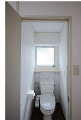
窓からの光を受けた棚には、植物を飾りたくくなります