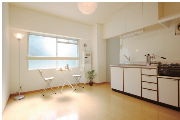
白を基調とした明るいダイニングキッチン