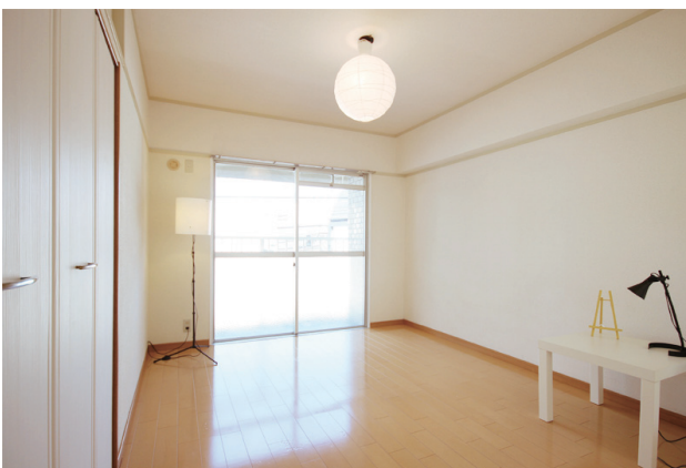
北東の部屋。こちらはクローゼット収納。隣の部屋とつながるバルコニーからは那珂川やキャナルシティも見える距離感。