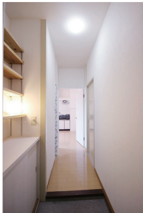
靴箱に備え付けの棚と玄関にも収納スペースが充実