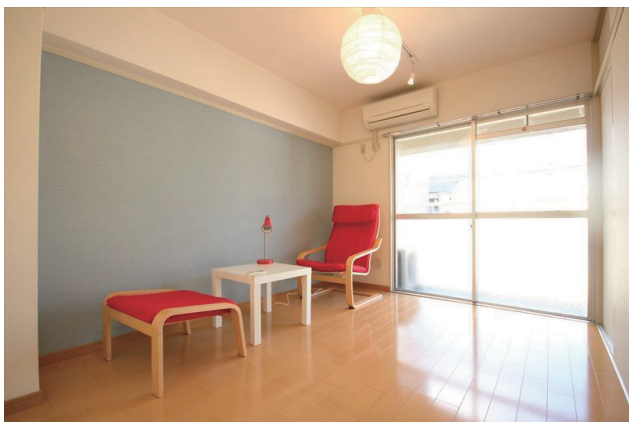
北西の部屋。押し入れ収納がひとつ。ライティングレールがついています。