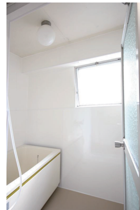
明るい浴室。床のタイルや浴槽のメンテナンスも◎