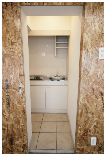
◇給湯室（電気コンロ付きキッチン）