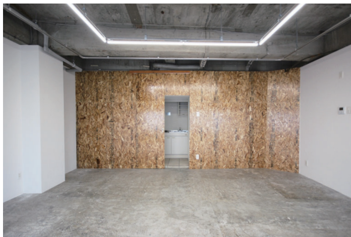
◇OSB板仕上げの壁の一体化された扉を開くと給湯スペースがあります