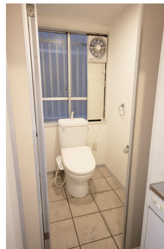
◇トイレ（ウォシュレット付き）