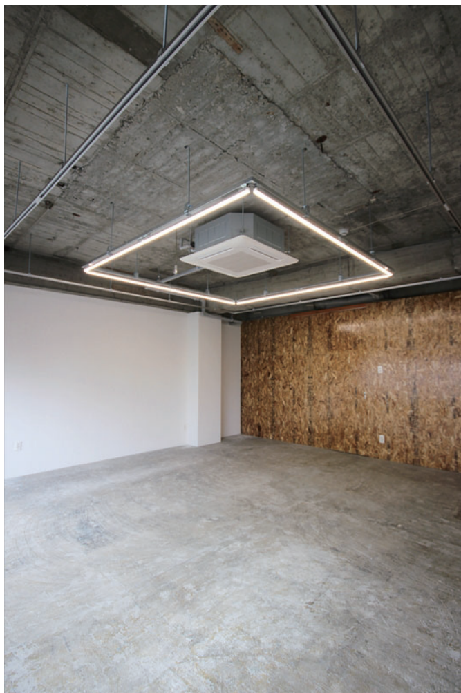
◇ライン照明、OSB板仕上げの壁が特徴的な空間