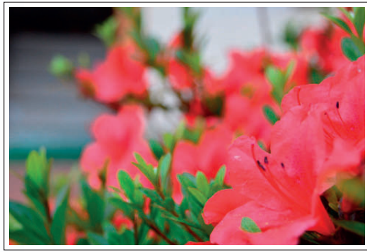
植木の日本四大生産地 久留米のシンボル「つつじ」。